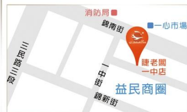
▲ 圖表三 睫老闆美容集團經銷商服務據點

服務電話: 0919-047333 地址: 台中市北區一中街162-1號 營業時間: (週二至週日) AM13:00~PM22:00 (週一公休)