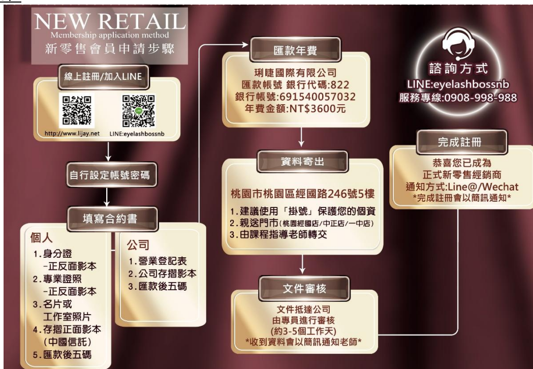
▲圖表一：新零售經銷入會流程圖